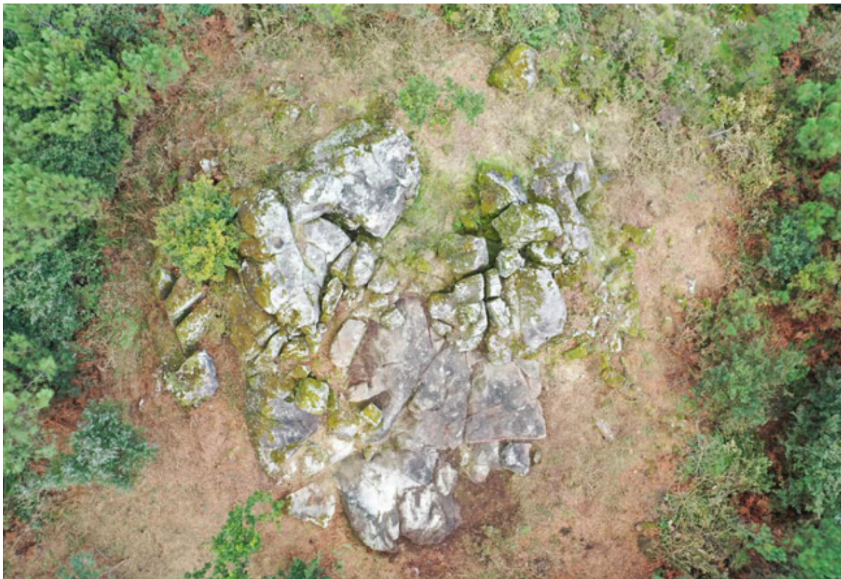
Imaxe: Concello de Dodro